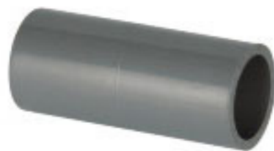
ข้อต่อตรงสีเทา TS SOCKET