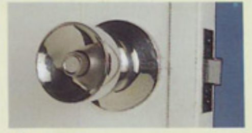
ลูกบิดอย่างดีติดตั้งไว้พร้อมสรรพ สะดวกในการเปิด-ปิด