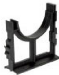
7.2 หัวรองท่อต่าง (BASE SPACERS)