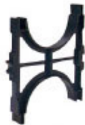
7.1 หัวรองท่อแบบ (INTERMEDIATE SPACERS)