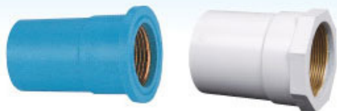
เกลียวในทองเหลือง